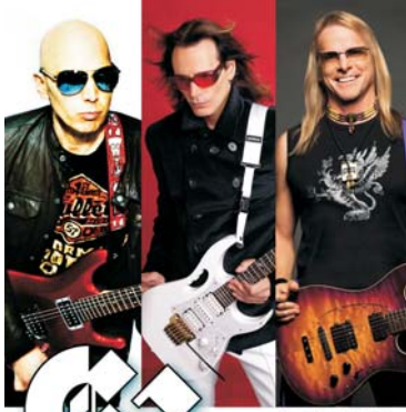
G3 EUROPE 2012 JOE SATRIANI-STEVE VAI-STEVE MORSE

Tüm gitar sevenlerin merakla beklediği, ünlü gitarist Joe Satriani tarafından organize edilen ve bugüne kadar sayısız gitarist ile dünyayı gezen G-3 konserlerinde bu yıl Joe Satriani ve Steve Vai'e, Avrupa turnesinde Steve Morse, Avustralya-Yeni Zelanda turnesinde Steve Lukather eşlik edecek.