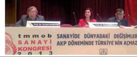
14 Ocak 2014 Akşam