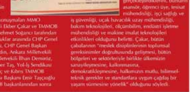
14 Ocak 2014 Akşam