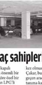
14 Ocak 2014 Ortadoğu