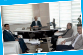
Anadolu Teknik Elemanlar Derneği