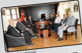
Ticaret Borsası Başkanlığı