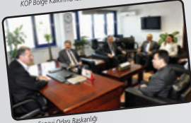
Konya Sanayi Odası Başkanlığı

• Bu topraklarda ülkemiz için stratejik öneme sahip tohum geliştirme çalışmaları yapılmaktadır. Böylelikle ülkemiz tohum üretiminde dışa bağımlı olmaktan kurtulmaktadır.