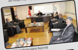
KOP Bölge Kalkınma İdaresi Başkanlığı