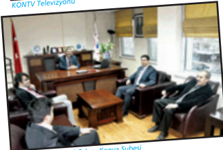
İnşaat Mühendisleri Odası Konya Şubesi