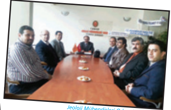
Jeoloji Mühendisleri Odası Konya Şubesi