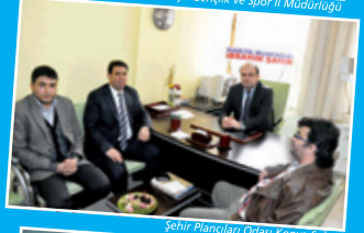
Şehir Plancıları Odası Konya Şubesi