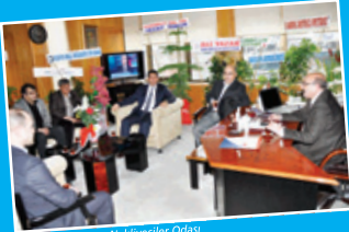
Konya Şoförler ve Nakliyeciler Odası