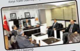
AKP Konya İl Başkanlığı