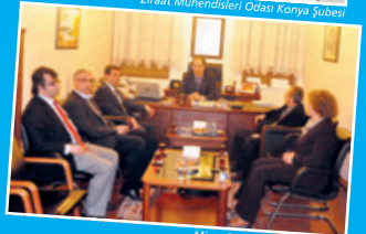
Mimarlar Odası Konya Şubesi