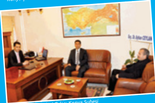
Harita Mühendisleri Odası Konya Şubesi