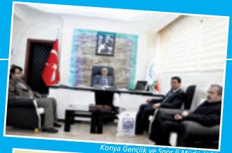
Konya Gençlik ve Spor İl Müdürlüğü