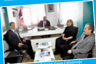
Bilim Sanayi ve Teknoloji Bakanlığı Konya İl Müdürlüğü