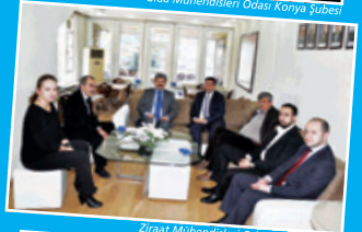
Ziraat Mühendisleri Odası Konya Şubesi