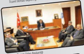
Konya Ticaret Odası Başkanlığı