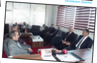
ASKON Konya Şubesi