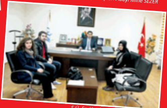
S.U. Endüstri Mühendisliği Topluluğu