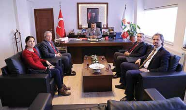
Çevre Şehircilik İl Müdürlüğü ziyareti