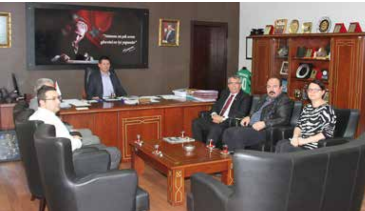
Merkezefendi Belediye Başkanlığı ziyareti