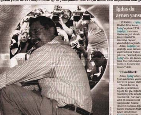
Botsas'ın Ankara Büyükşehir Belediye Başkanı Melih Gökçek'e bağlı olan Beşiktaş Gaz ve diğer kamu kuruluşlarından bakan fiyatları belirlediği 13 milyar YTL alacağı bekleniyor.