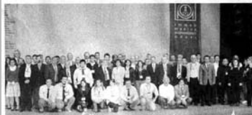
VII. Ulusal Ölçüm Bilim Kongresi TMMOB Makina Mühendisleri Odası tarafından düzenlendi.

VII. Ulusal Ölçüm Bilim Kongresi sonuç bildirisine göre 3.225 belediyenin sadece 169'unda ölçü ve ayar memuru bulunuyor