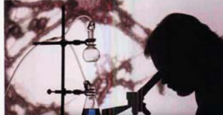
Gelişmekte olan ülkelerde en büyük sorunlardan biri, işletmelerin olandan Ar-Ge'ye fon ayırmaları ve ayrı-

28.02.2008 tarih ve "5746 sayılı Araştırma ve Geliştirme Faaliyetlerinin Desteklenmesine Yönelik Yasa'da, Ar-Ge personelinin yetiştirilmesine ve işletmelerde uzun vadeli istihdamına önem verildiği" söz konusu edilmektedir. Zira ancak böylece Ar-Ge alt yapısının geliştirilmesi ve yeteneklerinin kazanılması mümkün olabilecektir.