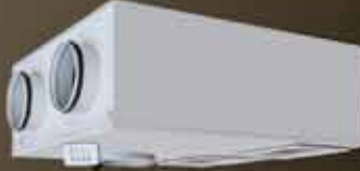
Isı Geri Kazanım Plug Fanlı Heat Recovery Unit With Plug Fan