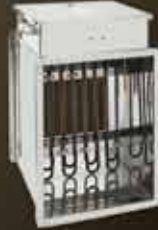
Kanal Tipi Elektrikli Isıtıcı Duct Type Electrical Heater