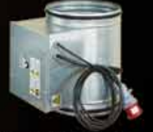
Kanal Tipi Elektrikli Isıtıcı Duct Type Electrical Heater