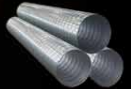
Havalandırma Kanalları ve Aksesuarları Ventilation Ducts and Accessories