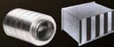
Kanal Tipi Susturucu Duct Type Silencer