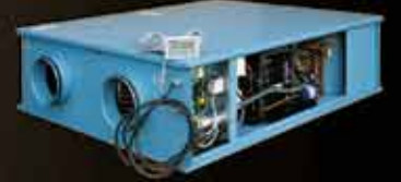
Isı Pompalı Isı Geri Kazanım Cihazı Heat Pump Heat Recovery Unit