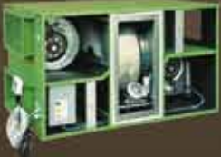
Enerji Geri Kazanım Cihazı Energy Recovery Unit