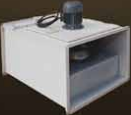
Mutfak Aspiratörü Kitchen Hood Aspirator