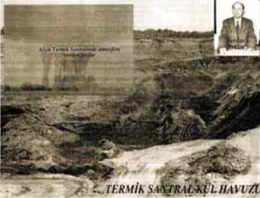
Alpaz Termik Santralinde santrallerin kurulacağı yer. TERMİK SANTRAL KÜL HAVUZU