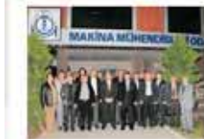
Makine Mühendisleri Odası Başkanı Alper Turna (ortada) ve yönetim kurulu üyeleri tarafından karşılanan Başkan Kocamaz, Mersin şehrinde bulunan sivil toplum örgütleri ile kapsamlı toplantılar yapıyor.

Tarsus Belediye Başkanı ve Mersin Büyükşehir Belediye Başkan Adayı Burhanettin Kocamaz, görüşme sonrasında bir süre eğitim kursu öğrencileriyle görüş alıştırdı. Karşılıklı konuşmaların hayata geçirilmesini talep etti.