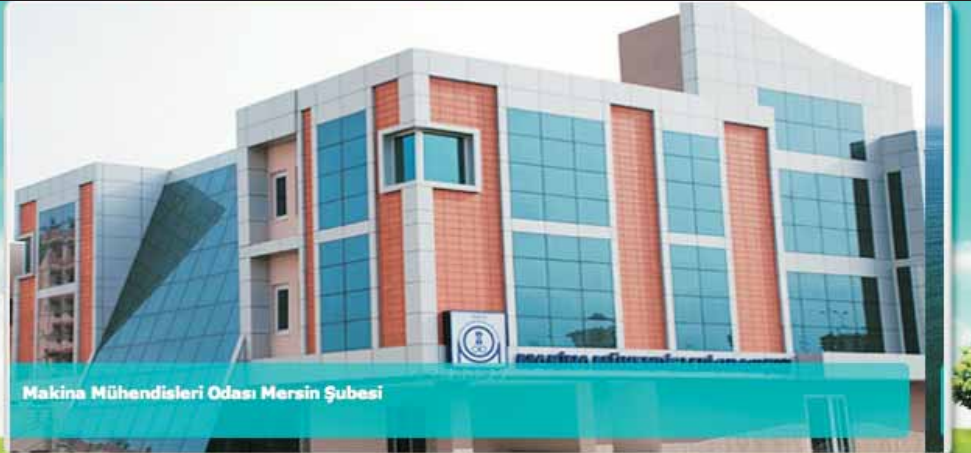
Makina Mühendisleri Odası Mersin Şubesi