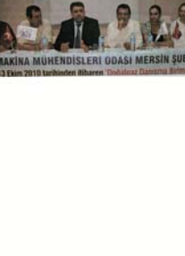
MAKİNE MÜHENDİSLERİ ODASI MERSİN ŞUBESİ

Mersin Tercüman Makine Mühendisleri Odası (MMMO) Mersin Şubesi tarafından düzenlenen 'Doğalgaz Danışma Birimi' ile vatandaşlara ücretsiz hizmet verecek.