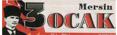
Yıl: 1 Sayı: 1 20 EKİM 2010