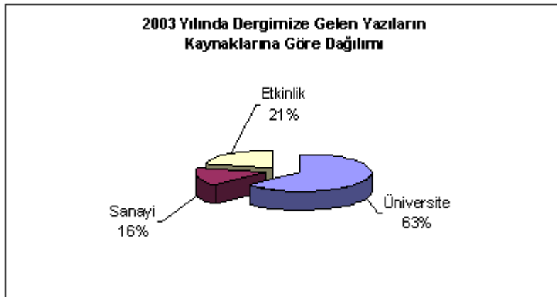
2003 Yılında Dergimize Gelen Yazıların Kaynaklarına Göre Dağılımı

2003 yılı yayın planı çerçevesinde Şubat sayımız "Toz Metalurjisi", Mart "Uzay-Havacılık", Mayıs "Çalışma Güvenliği" ve Haziran sayımız "Çevre ve Enerji Özel Sayıları olarak yayımlanırken "Kalite", "Otomotiv", "Malzeme" gibi konulardaki özel sayıların 2004 yılında yayın planı çerçevesinde üyelerimize sunmayı amaçlıyoruz.