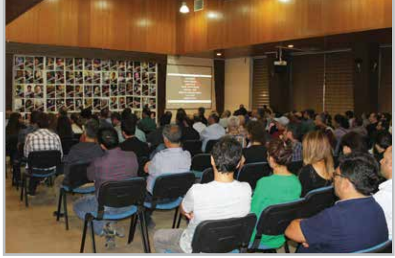
10 Ekim Ankara Katliamında Yitirdiğimiz Barış Elçileri Diyarbakır'da Anıldı