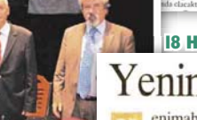
Asansörlerin güvenliğini sağlamak için çalışmalar yapıyorlar.

YENİMAHALLE Belediyesi'nin Asansör Kontrol Koordinatörlüğü bünyesinde yürüttüğü çalışmalar sonucu Yenimahalle'de asansörlerin güvenliğini sağlamak için çalışmalar yapıyorlar.