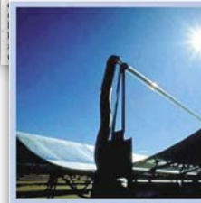
'Güneş ülkesi' Türkiye, potansiyelini değerlendirilmiyor

Makina Mühendisleri Odası'nın istisnasız istediği adımlarla başlatılan şu adımlar: • Enerji ile ilgili yasalarda güneş enerjisi yerleştirilerek, özellikle güneş enerjisinin su olarak kullanımına teşvik yönelik kanun, tüzetim, meslek odaları, uzmanlık dereceleri temsilcilerinin katılımıyla bir Güneş Enerjisi Strateji Planı ve bu planınla hareket etme bir yasa ve teknik mevzuat tedbirleri hazırlanmalıdır.