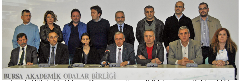
BURSA AKADEMİK ODALAR BİRLİĞİ

Tarihi miras üzerinde inşaatın devamını sağlayan Kültür Varlıklarını Koruma Kurulu kararının mahkeme tarafından durdurulduğunu hatırlatan Düşünceli, "Geçen hafta bilirkişi incelemesinin gerçekleştiği davada; hepimiz umutla yanlıştan dönülmesini, rant uğruna tarihi değerlerimizin yok olmasının önlenmesini beklerken, önce Mudanya Belediye Meclisi'nde, sonra da Büyükşehir Belediye Meclisi'nde onaylanan, bu-