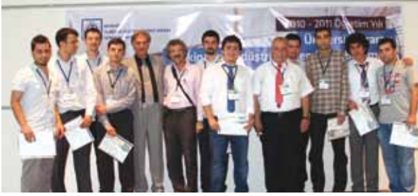
Makina Mühendisliği Bölümü - Ödül kazanan öğrencilerle birlikte.

Makina Mühendisliği Bölümü bitirme projesi birinciliğini bilimle sanatı birleştiren "Karbonfiber ve kompozit malzemedan kabak kemane projesi"; Endüstri Mühendisliği Bölümü birinciliğini ise "Akıllı yem dağıtım sistemi projesi" aldı.