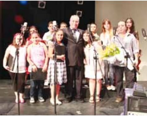
Şubemiz Çocuk Korosu