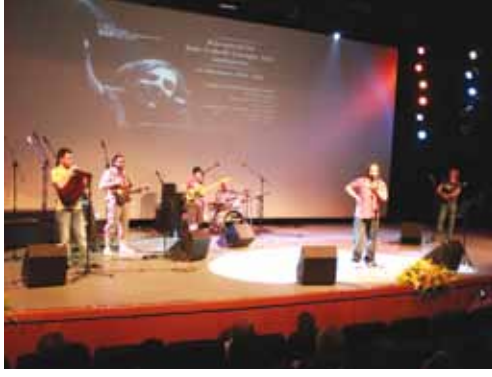
ENTU Müzik Grubu