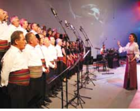
Şubemiz Halk Müziği Korosu

Şubemiz tarafından Kazım Koyuncu için düzenlenen “Karadeniz’in şair ceketli çocuğu için söylüyoruz” etkinliğini 800 kişi izledi. Türküler, horonlar ve Koyuncu’nun arkadaşı Harun Topaloğlu solistliğindeki ENTU (Karşı) Müzik Grubu seyircilere unutulmaz bir gece yaşattı.