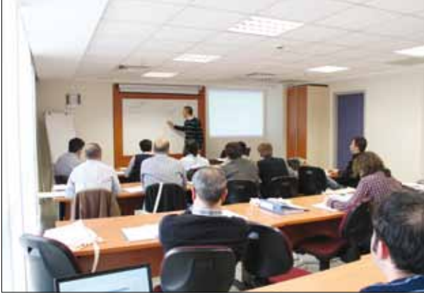
Kaynak Koordinasyon Personeli ve Temel Kaynak Bilgisi kursu.