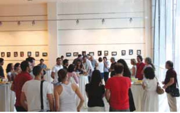
Açılış Kokteylinden bir görüntü.