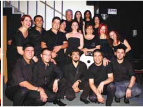
Şubemiz Perküsyon Grubu