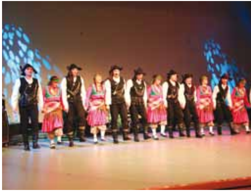
Şubemiz Halk Oyunları Ekibi