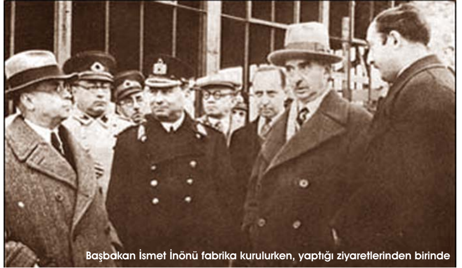
Başbakan İsmet İnönü fabrika kurulurken, yaptığı ziyaretlerinden birinde

Yerli kâğıdı üretecek modern bir kâğıt fabrikasının kurulması, İzmit Kâğıt Fabrikası'nın kuruluşundan önce 1930'larda gündeme geldi. Önce Tekel Bakanlığı'nın ihtiyaçlarını karşılamak için bir kâğıt fabrikası kurulması düşünüldü. Ancak; kurulacak böyle bir fabrikanın mutlaka zarar edeceği yolunda yazılıp çizilenler karşısında hükümet dosyayı kaldırdı. Yerli kâğıt üretilmesini destekleyenlerin itirazlarının yükselmesi konuyu Atatürk'ün