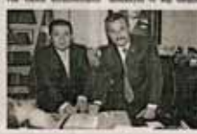
Toroslar Belediyesi Başkanı Mustafa Karaman'ın başkanlığında gerçekleştirildi.

Asansör Mersin'in Toroslar İlçesindeki Toros ve Yedigöller Mahalle Müktesitleri, Akdeniz Bölge Belediye Başkanları Alper Turan ve Yedigöller Mahalle Müktesitleri Başkanı Mustafa Karaman'ın başkanlığında gerçekleştirildi. Toroslar Belediyesi Başkanı Mustafa Karaman'ın başkanlığında gerçekleştirildi. Toroslar Belediyesi Başkanı Mustafa Karaman'ın başkanlığında gerçekleştirildi.