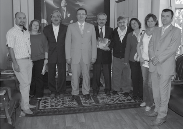
Gönen İlçe Kaymakamı Bekir Dinkırcı ziyaret edildi