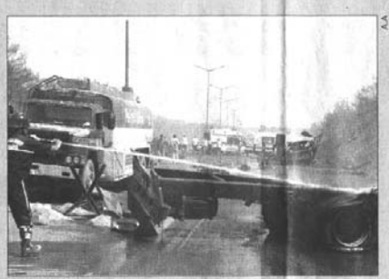
Gaziantep'te 15 kişinin ölümüne neden olan LPG yüklü tankerin patlamasının standart ve denetim ihlallerinden kaynaklandığı savunuldu.