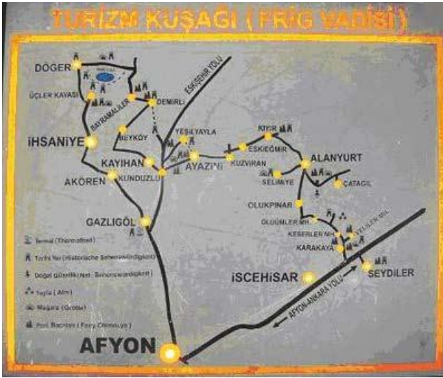
Harita-1 Turizm Kuşağı

Friglerin hüküm sürmüş olduğu, İlimiz sınırları içinde de yer alan Frigya vadileri; Afyonkarahisar ve Kütahya illerini de kapsayan bir üçgen içersinde yer almaktadır.