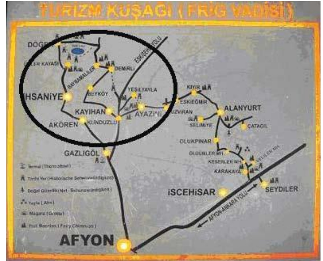
Harita-2 Turizm Kuşağı

uzunca yürüyüşler yaptık. Keşfetmek için çıkmıştık yola ve bu keyifli yolculuğu Ayazini'nde sonlandırmamız gerekiyordu.