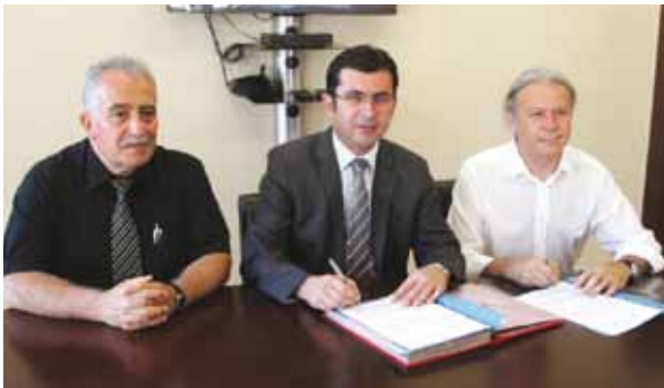
Bergama Belediyesi ile protokol imzalanırken.

Asansörlerin periyodik kontrollerinin A tipi muayene kuruluşlarınca yapılması gereği, Şubemiz ile İzmir'in Bergama ve Dikili Belediyeleri arasında protokol imzalandı.