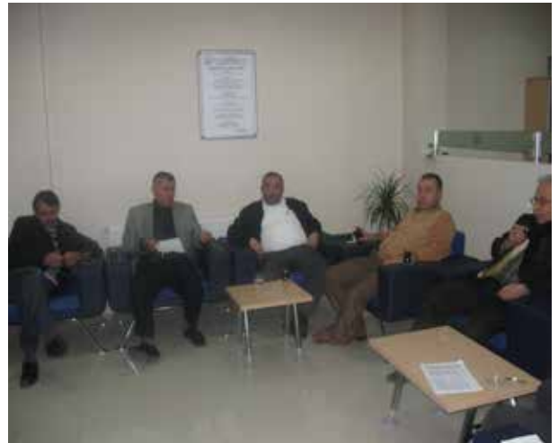
07 Mart 2013 SMM'li üyelerimizle genel sorunları görüşmek üzere toplantı yapıldı.