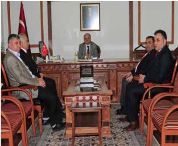
26 Şubat 2013 Tarihinde Kırşehir Valisi Özdemir ÇAKAÇAK makamında ziyaret edildi.