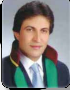
Av. Ramazan BEDİR