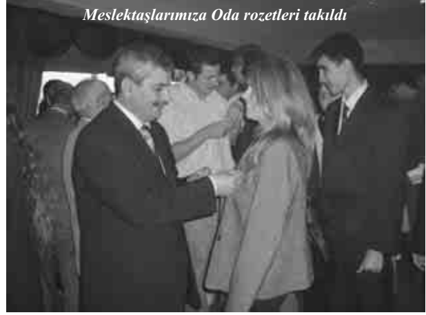
Meslektaşlarımıza Oda rozetleri takıldı

yapacağız ve toplumumuza dayatılan politikaları sorgulayacak, halkımızın ve ülkemizin çıkarı doğrultusunda bilgi akışını toplumumuza sunmaya devam edeceğiz