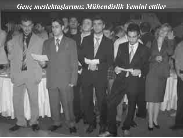
Genç meslektaşlarımız Mühendislik Yemini ettiler

devam edeceksiniz. Meslek içi eğitimler yaşamınız boyunca devam edecek ve bu durumda Odamız devamlı yanınızda olacaktır.