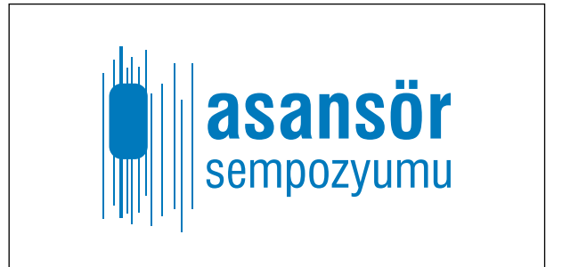
"Asansör Sempozyumu" için seçilen tasarım - Burçin Karaduman