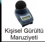
Kişisel Gürültü Maruziyeti