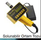
Solunabilir Ortam Tozu

İş Sağlığı ve Güvenliği Kanunu, Madde 10'a göre; (4) İşveren, iş sağlığı ve güvenliği yönünden çalışma ortamına ve çalışanların bu ortamda maruz kaldığı risklerin belirlenmesine yönelik gerekli kontrol, ölçüm, inceleme ve araştırmaların yapılmasını sağlar. Bu kapsamda Merkez Laboratuvarı tarafından gerekli ölçüm ve analizler akredite olarak yapılacaktır. Çalışma ve Sosyal Güvenlik Bakanlığı tarafından yayınlanan mevzuatlar gereği yapılacak İŞ HİJYENİ ölçümleri: