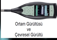
Ortam Gürültüsü ve Çevresel Gürültü