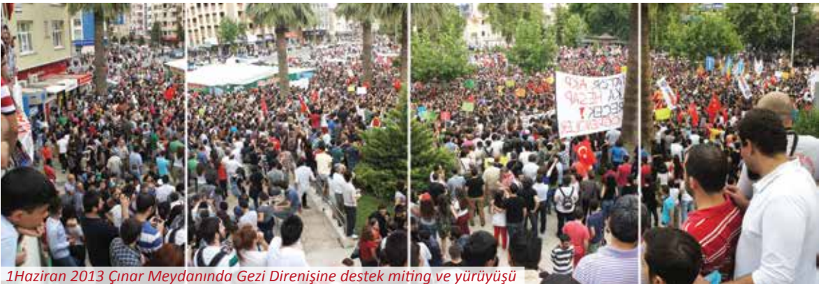
1Haziran 2013 Çınar Meydanında Gezi Direnişine destek miting ve yürüyüşü

Son görkemli yürüyüş 16 Haziran tarihinde gerçekleşti. On bini aşkın kitlesel yürüyüş bu kez tersine biz rota izleyerek Kayalık, İnönü caddesi, İstiklal Caddesi, Çaybaşı ve Saltak caddelerinden Bayramyerine geçip, Atatürk Bulvarından Çınar Meydanına geldi. Burada yapılan konuşmalarla miting sona erdi.