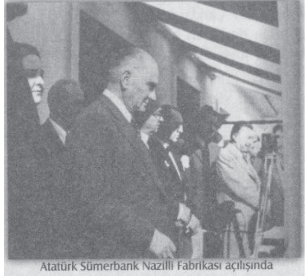
Atatürk Sümerbank Nazilli Fabrikası açılışında