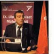
IX. Ulusal Tesiilat Mühendisliği Kongresi, 6-9 Mayıs 2009 tarihleri arasında İzmir'de, MMO Tepekule Kongre ve Sergi Merkezi'nde yapıldı.

TMMOB Makina Mühendisleri Odası'nın 16 yıldan beri düzenlediği Ulusal Tesiilat Kongresi'nin 9'uncusu, "Binalarda Enerji Performansı" temasıyla İzmir'de yapıldı. Kongre, artan enerji ihtiyacımız ucuz, sürüklü ve güvenli bir şekilde karşılama konusunda önemli adımlar atılmıştır. Türkiye'nin en önemli problemlerinden biri olduğunu söyleyen MMO Yönetim Kurulu Başkanı Emin Koramaz, sözlerini şöyle sürdürdü: "Ülkemiz, enerji alanında %75'er oranında dışa bağımlı. 2008 yılında enerji ithalatı için ödediğimiz tutar 48 milyar dolara ulaştı. Bu rakam toplam ihracatımız %37'sine karşılık geliyor. Gereki ödemeler artmazsa yılın bir gelecekte ülkemizin bir enerji dışı bozucu ve krizi ile karşı karşıya kalacağız."