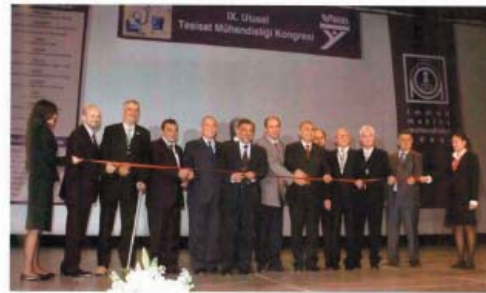
Kongre kapsamında düzenlenen Teskon-Sodex Fuarı 6-9 Mayıs 2009 tarihleri arasında İzmir'de, MMO Tepekule Kongre ve Sergi Merkezi'nde yapıldı. Fuar 20'ye yakın alana üzerine temsillerle birlikte 152 firmanın katılımıyla 1400'er metrekare alanında gerçekleştirildi. Fuarın ve kongrenin açılış konuşmaları kongreyle birlikte yapılan basın toplantılarında yapıldı.