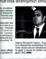
15-16 HAZİRAN Emekçilerin tek çaresi direniş