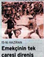
15-16 HAZİRAN Emekçilerin tek çaresi direniş

15-16 Haziran tarihinin emek mücadelesinin en önemli günlerinden olduğunu belirten Soğanç, "Kapitalizmin geleceği yok. Bizler insanlığın yok oluşu sürüklenmesine karşı onların direnişimizi omuz omaza bir arada sürdürmeliyiz" dedi.