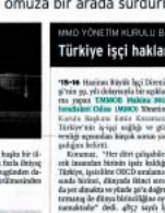
15-16 HAZİRAN Emekçilerin tek çaresi direniş