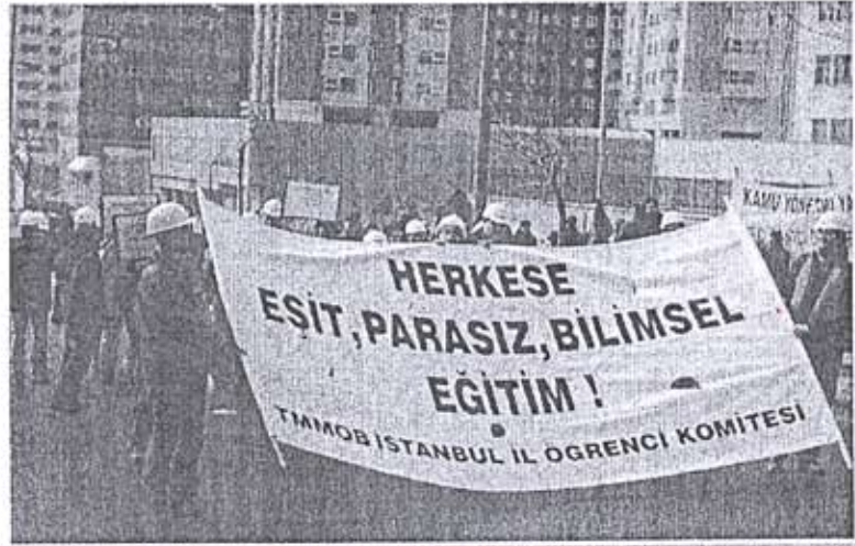
► Mühendislik öğrencileri demokratik tepkilere katılıyor.

netimler projeleri büyük bir oranda şubemizin mesleki denetiminden geçirmektedirler. Şubemizin bu çalışmalarından ötürü ülkemiz ölçeğinde de artık tüm yerel yönetimler projeleri şubelerimizdeki mesleki denetimden geçirmektedirler.