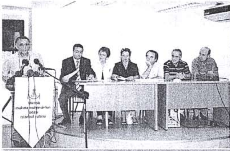
► LPG İkmal İstasyonlarında ve Akaryakıt İstasyonlarında Denetimsizlik paneli.

yathane, yoğun bakım ve karantina bölümlerinin mekanik tesisatına ve buralarda hijyenik ortamın nasıl sağlanmasına çevirdi. Şimdi tüm sektör bunu konuşuyor, tüm hastane yönetimleri sistemlerini gözden geçiriyor. Tüm sektör dernekleri hastanelerin ameliyathane ve yoğun bakım bölümlerinin mekanik tesisatlarını tartışıyorlar, sektör dergilerinde hep bu konu konuşuluyor ve konuşmaya devam edecek. Dolayısıyla Odamız toplum yararına fayda üretme görevini yapmaya devam ederken diğer yandan meslek alanlarından kalkarak