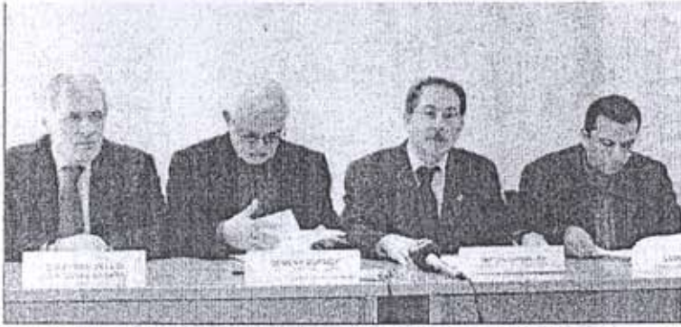
Emek Platformu, 19 Mart'ta Kadıköy'de gerçekleştireceği mitingi duyurmak için TMMOB Makina Mühendisleri Odası'nda bir basın açıklaması yaptı.

Irak'ın işgalinin 2. yıldönümü olan 19 Mart eylem günü