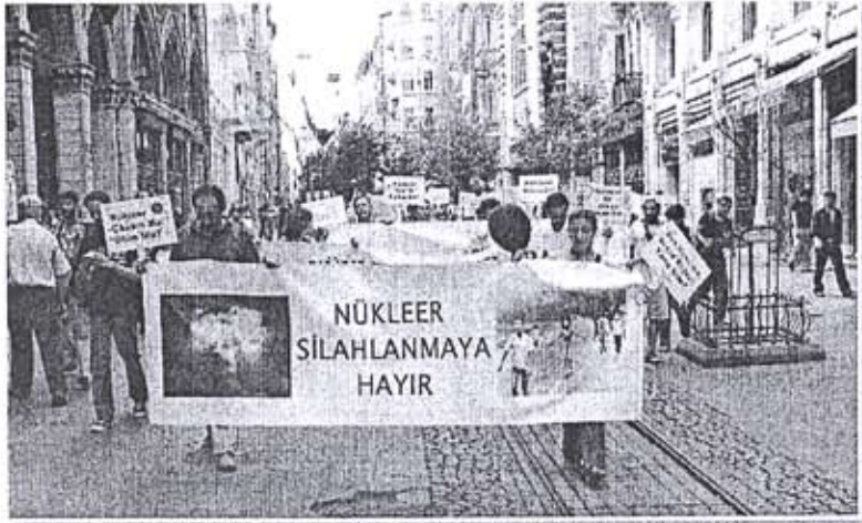
► Hiroşima'nın yıldönümünde nükleer karşıtı bir eylem.