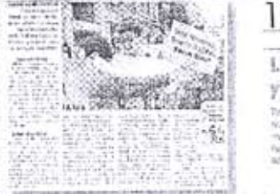
Silaha da santrale de havır! Silaha da santrale de havır!