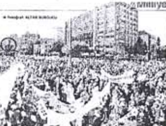
Mitingte katılımcılar, 'ABD ve IMF'ye sert protesto' sloganı ile seslendi.