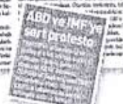
'ABD ve IMF'ye sert protesto' sloganı ile seslendi.

TMMOB Mühendis ve Mimar Odaları Birliği, Ankara'da 'Demokratik Türkiye ve İnsanca Yasam' mitingini düzenledi. Başkan Soğanca, demokratik bir Türkiye için YÖK'ün kaldırılmasını istedi.