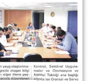
Kongre, Sektörel Uygulamaları ve Otomasyon ve Kontrol Tekniği'ne ilişkin çalışmaların yürütülmesi için bir yasa ve ikinci mevzuat ile hazırlanmalıdır.