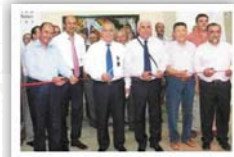
"Enerji Verimliliği Eğitim ve Uygulama Merkezi" törenle hizmete sunuldu.