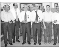
İYTE Urla Kampüsünde inşa edilen "Enerji Verimliliği Eğitim ve Uygulama Merkezi" açıldı...

İYTE Urla yerleşkesinde 'Enerji Verimliliği Eğitim ve Uygulama Merkezi' törenle hizmete girdi