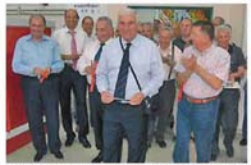
yerleştirdiklerini hatırlatarak, 'İlk kurumumuz Kasım 2009'da düzenlenlik Enerji Yöneticisi eğitiminin ülke geneline yaygınlaşması...