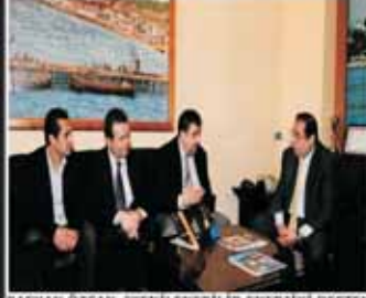
BAŞKAN ÖZCAN, "YENİLENEBİLİR ENERJİYİ DESTEKLİYORUZ"