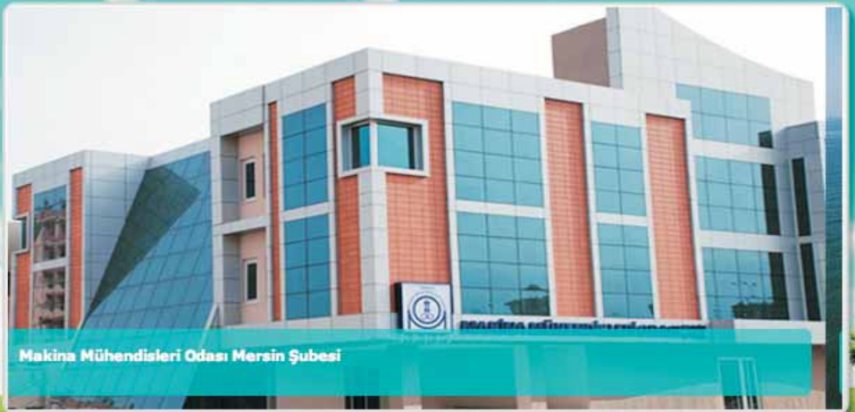
Makina Mühendisleri Odası Mersin Şubesi