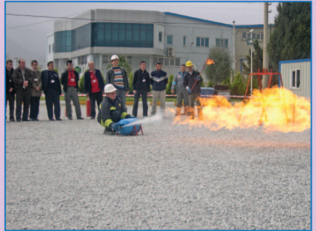
LPG Dolum ve Boşaltım Personeli Eğitimi yapıldı

Türk Sanat Müziği Konseri büyük ilgi gördü