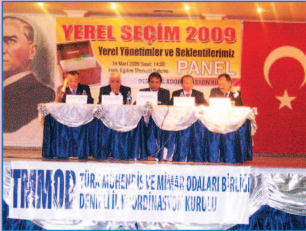
TMMOB Denizli İl Koordinasyon Kurulu'ndan YEREL YÖNETİMLER ve BEKLENTİLERİZ paneli