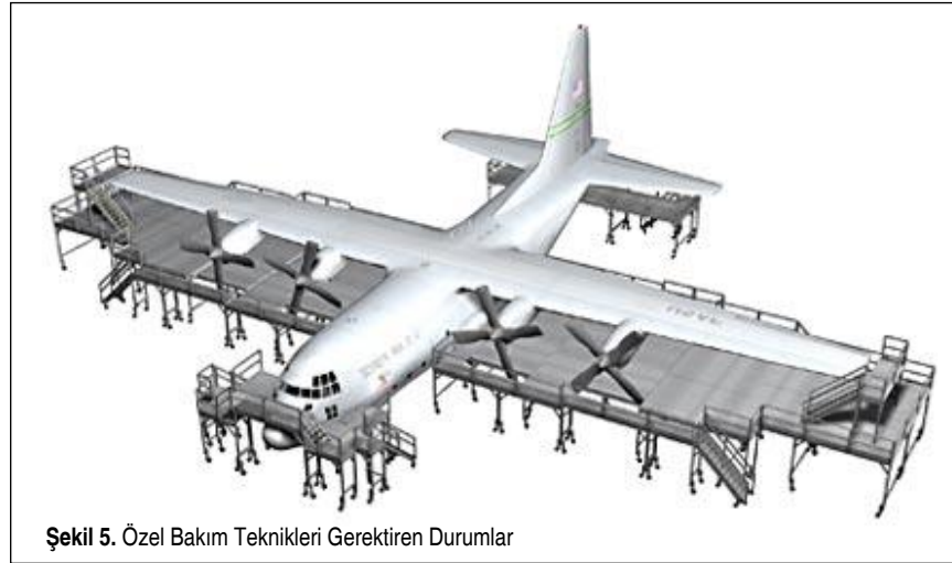
Şekil 5. Özel Bakım Teknikleri Gerektiren Durumlar