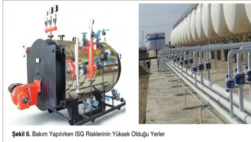
Şekil 6. Bakım Yapılırken İSG Risklerinin Yüksek Olduğu Yerler

analizlerinin bir ekip tarafından sürekli olarak tekrarlanması gerekmektedir.