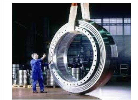
Şekil 2. Teknolojik Gelişimlerden Örnekler