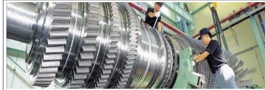
Şekil 4. Büyük Hacimli ve Ağır Makinaların Bakımlarındaki İSG Riskleri

Arıza bakımlarda rutin yapılan işlemler dışında ters giden durumlar oluşabilmektedir. Özellikle hacim ve ağırlık bakımından büyük ekipmanların bakımları ve arızaları da o düzeyde zorlaşmaktadır. Bu bakım faaliyetleri için öngörülebilir risk analizleri daha önceden yapılmış ve gerekli önlemler alınmış olsa da işin yapım aşamasında gözden kaçan durumlar oluşabilmektedir. Risk