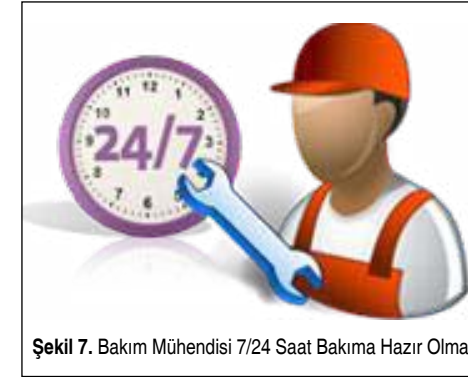
Şekil 7. Bakım Mühendisi 7/24 Saat Bakıma Hazır Olmalı

Üretim tesislerinden bazıları pazar günleri veya resmi tatillerin belli günleri çalışmamaktadır. Pazar günleri ve resmi tatil günleri bakım mühendisinin işlerinin yoğunlaştığı günlerdir. Çünkü üretim yapılmayacak olması makinaların bakımlarının yapılması için uygun günler olarak görülebilmektedir. Birde,