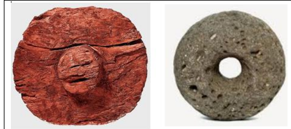
Şekil 1. İlk Tekerlek Modellerine ait Örnekler

İcatlar ilerledikçe, öncelikle, bozulan ekipmanların tamir gereksinimi