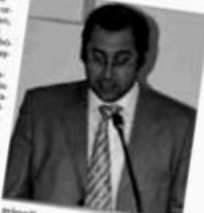
Yatırımcıların ısı yalıtımını tamamlamadan ısı pay ölçer kullanmaları, beklenen tasarrufu sağlamaz. Isı yalıtımının tamamlanmadan ısı pay ölçer kullanılması, enerji verimliliği açısından beklenen tasarrufu sağlamaz.

Isı yalıtımının yapılmadığı binalarda ısı pay ölçer kullanılması, beklenen tasarrufu sağlamaz. Isı yalıtımının tamamlanmadan ısı pay ölçer kullanılması, enerji verimliliği açısından beklenen tasarrufu sağlamaz. Isı yalıtımının tamamlanmadan ısı pay ölçer kullanılması, enerji verimliliği açısından beklenen tasarrufu sağlamaz.