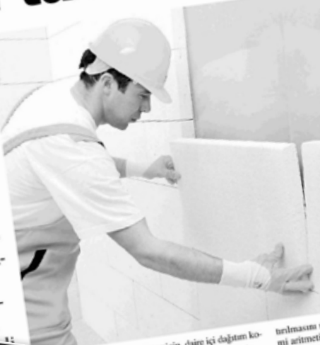
Merkezi sistemli binalarda kalorimetre veya ısı pay ölçer uygulamaları için rakam üzerinden yıldırımlaştırma yapılmamalıdır.