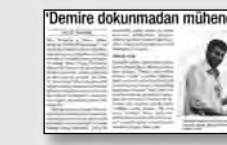
11.01.2014 Birgün Gazetesi