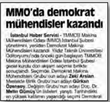
20.01.2014 Cumhuriyet Gazetesi