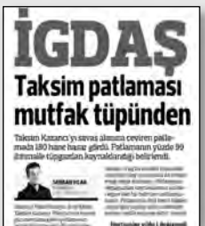
19.02.2014 Radikal Gazetesi