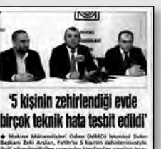
09.02.2014 Zaman Gazetesi