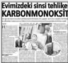
25.01.2014 Aydınlık Gazetesi