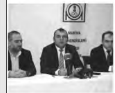
11.01.2014 Birgün Gazetesi