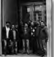
11.01.2014 Birgün Gazetesi