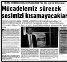
11.01.2014 Birgün Gazetesi