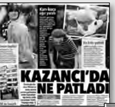
19.02.2014 Hürriyet Gazetesi