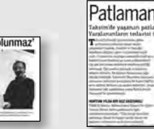
19.02.2014 Taraf Gazetesi