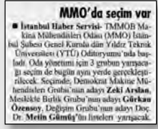
19.01.2014 Cumhuriyet Gazetesi