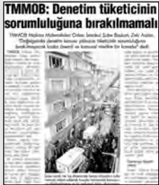
11.02.2014 Bizim Gazetesi