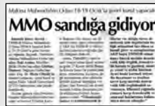
17.01.2014 Cumhuriyet Gazetesi