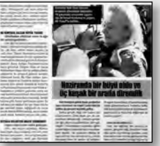
11.01.2014 Birgün Gazetesi