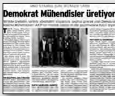
18.01.2014 Birgün Gazetesi