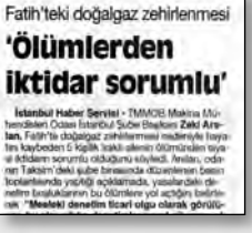
09.02.2014 Cumhuriyet Gazetesi