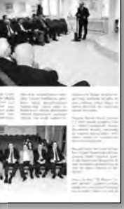
19.02.2014 Otomasyon Dergisi