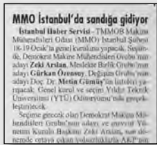
17.01.2014 Cumhuriyet Gazetesi