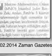
10.02.2014 Zaman Gazetesi