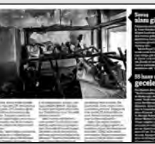
19.02.2014 Radikal Gazetesi