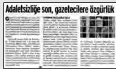
13.01.2014 Birgün Gazetesi