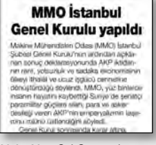
20.01.2014 Sol Gazetesi