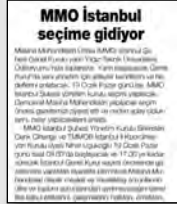
17.01.2014 Sol Gazetesi