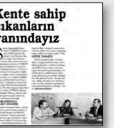
19.02.2014 Evrensel Gazetesi