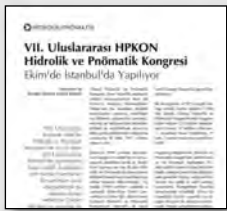
11.01.2014 Birgün Gazetesi