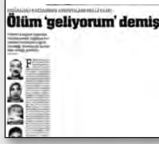
09.02.2014 Türkiye Gazetesi