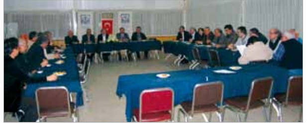
Aliğa İlçe Temsilcilik Toplantısı