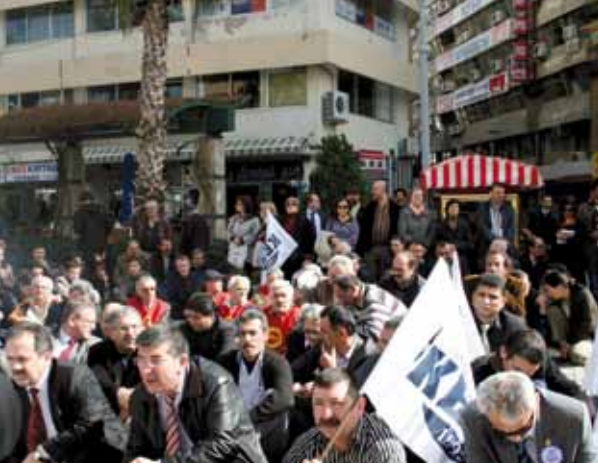
Tekel İşçileri "Oturma Eylemi" - İZMİR

tamamen kapatıldı. 17 tane fabrikayla çıkılan ihalede... Bunlardan İzmir, İstanbul, Ankara içki fabrikalarının 5 yıllık kiralık olarak alıcı firmaya devri söz konusu oldu. 175 tane ayrı ürün söz konusu, ayrı etiket söz konusu, TEKEL'in alkollü içkiler sektöründe 125 tane ayrı ürünü söz konusu. Bakın, sadece " Yeni Rakı "nın isim hakkını satmaya kalksalar, isim hakkı bile 292 milyon dolardan kat be kat daha fazla ederdi.