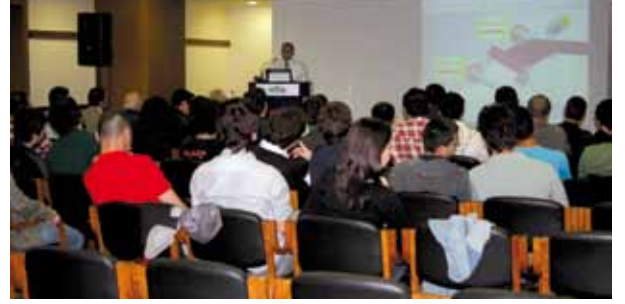
"Mekatronik Sistemlerin Gözü Kulağı Sensörler" semineri.

Mekatronik Seminerleri kapsamında 27 Mart 2010 Cumartesi günü 55 öğrenci üyemizin katılımıyla "Mekatronik Sistemlerin Gözü Kulağı Sensörler" konulu seminer gerçekleşti.