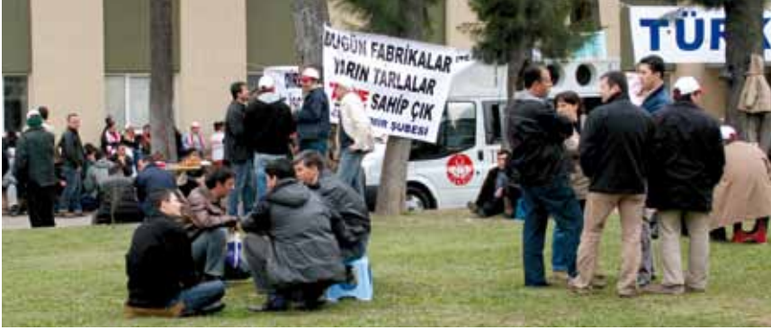
Tariş işçileri eyleminden.

TARİŞ İplik A.Ş.'nin işten çıkardığı 560 çalışanı fabrikalarını kapattırmamak ve tazminatlarını almak için mücadele başlattı. Aralarında üyelerimizin de bulunduğu çalışanlar, 2007 yılında 100 Milyon TL sermaye ile A.Ş. olan Tariş İplik'in 2 yılda kasasının nasıl sıfırlandığına akıl erdiremiyorlar!