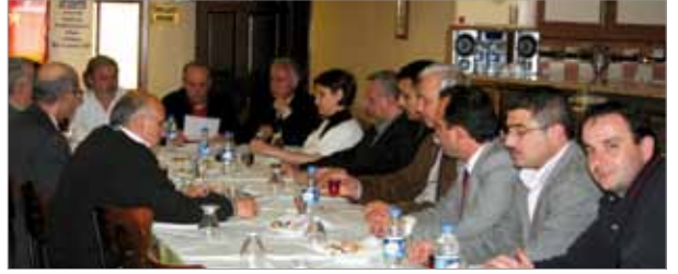
Akhisar İlçe Temsilcilik Toplantısı