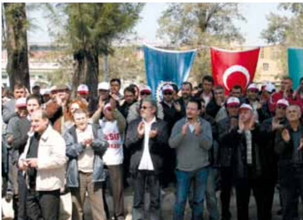
TMMOB İKK üyeleri Tariş işçilerine destek ziyareti.

TMMOB ekibi ziyaretin ardından Tariş işçilerinin alkışları ve sloganlarla uğurlandı.