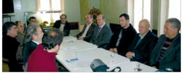
Ödemiş İlçe Temsilcilik Toplantısı