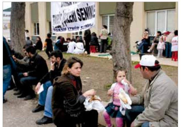
Tariş işçileri eyleminde öğle yemeği molası.

Çiğli Tariş İplik'te tüm bunlar hangi hukuksal zeminde yapılmaktadır? İşçi alacakları, hak ettiğimiz tazminatlar nasıl yok edilebilmektedir? 100 milyon TL sermayeli bir fabrika 20 ayda nasıl "tedbiren tasfiye" edilecek hale getirilmiştir? Tüm bunların yanıtlarını istiyoruz? Hakkımızı savunmak için mücadele edeceğiz. Bu mücadelede tüm İzmirli ve meslektaşlarımızı yanımızda görmek istiyoruz."