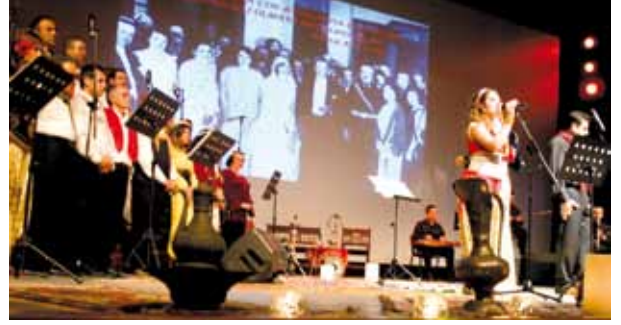
"Anadolunun Renkli Taşları Konseri", Halk Müziği Korosu Tepekule Kongre ve Sergi Merkezi, Anadolu Salonu.

8 Mart Dünya Emekçi Kadınlar Günü'nde TMMOB İKK Kadın Çalışma Grubu tarafından düzenlenen "Anadolu'nun Renkli Taşları Konseri"nde MMO İzmir Şubesi Halk Müziği Korosunu 500'ü aşkın dinleyici ayakta alkışladı.