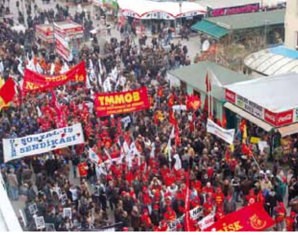
Tekel İşçileri yürüyüşü - ANKARA

Sizin uygulamış olduğunuz bu politikalar bu ülke halkının faydasına değilse kimin faydasına, kimin adına bu uygulamaları yapıyorsunuz?