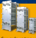
Sıvı gıda, ısıtma ve soğutma uygulamalarında plakalı ısı değişicileri