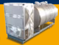
Süt soğutma tankları