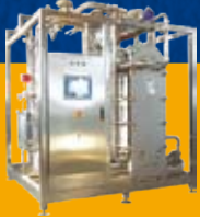
PLC ve PID kontrollü pastörizatörler