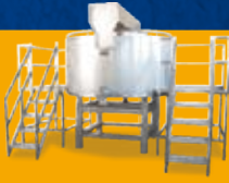
Kaşar proses tankları