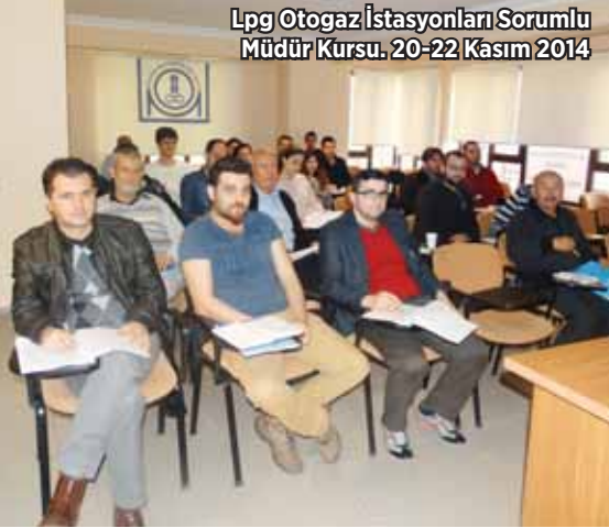
Lpg Otagaz İstasyonları Sorumlu Müdür Kursu. 20-22 Kasım 2014

şarı gösteren 76 üyenin uzmanlıkları belgelendirildi. LPG piyasasında görev yapan LPG Dolu-Boşaltım personeline yönelik düzenlenen eğitimde 10 kişi belgelendi.