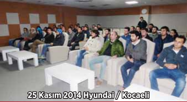
25 Kasım 2014 Hyundai / Kocaeli

Eskişehir Makina Mühendisleri Odası Şubesi Öğrenci Üye Komisyonu'nun, talepleri doğrultusunda teknik geziler düzenlendi. Hyundai Assan Otomotiv Sanayi ve Ticaret A.Ş.'nin Kocaeli Ali Kahya'daki Fabrikası'na 25 Kasım 2014 tarihinde Makina ve Endüstri Mühendisliği bölümlerinde 45 öğrenci üyenin katılımıyla, Eskişehir-Çukurhisar'daki Hisarlar Makina Sanayii A.Ş.'ye 10 Aralık 2014 tarihinde Makina ve Endüstri Mühendisliği bölümlerinde 39 öğrenci üyenin katılımıyla teknik gezi gerçekleştirildi. Her iki gezide de fabrika yetkililerince tanıtım sunumları yapıldı. Sunumlarda üretim süreçleri, makina ve endüstri mühendislerinin bu süreçlerdeki görevleri ve fonksiyonları hakkında bilgiler verildi. Tanıtım sunumlarının ardından üretim hatları gezildi.