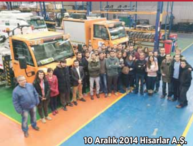
10 Aralık 2014 Hisarlar A.Ş.