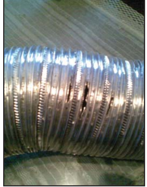
Olay mahalinde çekilen, doğal gaz sızıntısına neden olan bacadaki yırtıkları gösteren fotoğraflar

şirketlerinin periyodik kontrol ve denetimleri yapması zorunlu hale getirilmelidir. Örneğimizde, olayın mağdurlarının eğitilmiş bir kesimden oluşması, bu konunun yalnızca tüketicinin sorumluluğuna bırakılmayacak kadar ciddi bir boyut içerdiğini göstermektedir.