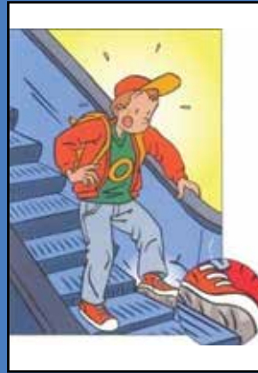
Basamak ile yan korkuluk arasında boşluk olması,