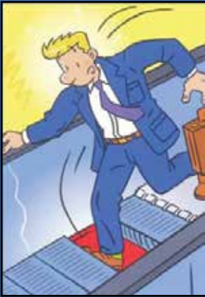
Eksik basamak veya paletlerin bulunması