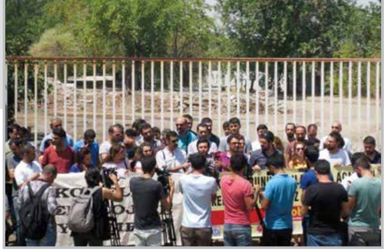
Diyarbakır'ı Nefessiz Bırakmayın!