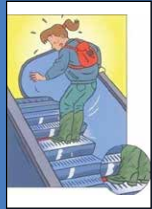
Basamak ile paletler arasında var olan boşluklar.