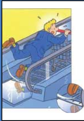
Giriş bölgesinin kaymayı önleyici yüzeye sahip olmaması.