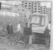
Operatör kursu başladı.