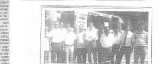
Doğal gaz eğitimi kapsamında düzenlenen eğitimde, katılımcılara sertifikaları verildi.

E ĞİTİMDE katılımcılara, doğal gazın güvenli ve verimli kullanılmasını sağlamak amacıyla eğitimler verildi. Eğitimde, katılımcıların doğal gazın güvenli ve verimli kullanılmasını sağlamak amacıyla eğitimler verildi.