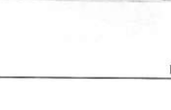
Eğitim toplantısı kapsamında düzenlenen eğitimde, katılımcılara sertifikaları verildi.

M AKİNE Mühendisleri Odası Samsun Şubesi tarafından düzenlenen eğitim toplantısı, katılımcıların bilgi seviyelerini artırmaya yardımcı oldu. Eğitimde, katılımcıların işyerilerinde güvenli ve verimli çalışmalarını sağlamak amacıyla eğitimler verildi.