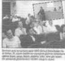
Seminerde katılımcılar, ürün güvenliği konularında uzmanlar tarafından yapılan eğitimleri dinliyor.

S AMSUN'da düzenlenen eğitimde, ürün güvenliği konularında uzmanlar tarafından yapılan eğitimler, katılımcıların bilgi seviyelerini artırmaya yardımcı oldu. Eğitimde, ürün güvenliği konularında uzmanlar tarafından yapılan eğitimler, katılımcıların bilgi seviyelerini artırmaya yardımcı oldu. Eğitimde, ürün güvenliği konularında uzmanlar tarafından yapılan eğitimler, katılımcıların bilgi seviyelerini artırmaya yardımcı oldu.