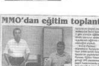
Operatör yetiştirme kursu kapsamında düzenlenen eğitimde, katılımcılara sertifikaları verildi.

M AKİNE Mühendisleri Odası Samsun Şubesi ve Makineci Kurumları Operatör Yetiştirme Kursu'nun devam ediyor. Eğitimde, operatörlerin işyerilerinde güvenli ve verimli çalışmalarını sağlamak amacıyla eğitimler verildi. Eğitimde, operatörlerin işyerilerinde güvenli ve verimli çalışmalarını sağlamak amacıyla eğitimler verildi.