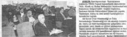
AB Genel Ürün Yönetmeliği ve Ürün Sorumluluğu Yönetmeliği Eğitim Toplantısı, Samsun Makine Mühendisleri Odası'nda yapıldı.

AB Genel Ürün Yönetmeliği ve Ürün Sorumluluğu Yönetmeliği Eğitim Toplantısı, Samsun Makine Mühendisleri Odası'nda yapıldı. Toplantıda, kamu ve özel sektör temsilcilerine "Ürün Yönetmeliği ve Ürün Sorumluluğu" konusunda AB direktiflerinin uygulanması ve kullanıma detayları hakkında bilgiler verildi.