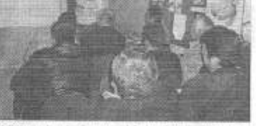
İş Makinaları Operatör Yetkilendirme Kursu düzenlendi.