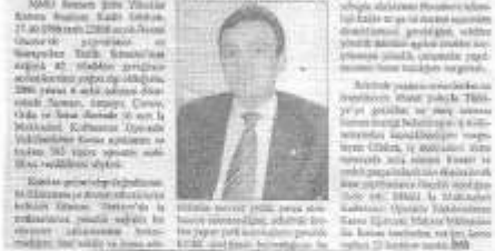
Operatör yetiştirme kursu kapsamında düzenlenen eğitimde, katılımcılara sertifikaları verildi.

M AKİNE Mühendisleri Odası Samsun Şubesi ve Makineci Kurumları Operatör Yetiştirme Kursu'nun devam ediyor. 383 kişiye operatör sertifikası verildi. Eğitimde, operatörlerin işyerilerinde güvenli ve verimli çalışmalarını sağlamak amacıyla eğitimler verildi.