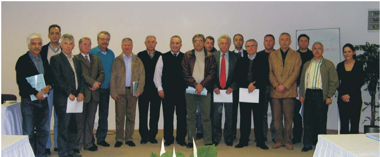
İzbeton Genel Müdürü ve üst düzey yöneticileri Şube Başkanımız ve Eğitim Sorumlumuz ile görünüyorlar.

Eğitim kapsamında İZBETON'da görev yapan 15 kişilik üst düzey yönetici grubuna "Değişim, küreselleşme ve yeni yönetsel yaklaşımlar", "Motivasyon ve liderlik", "Yönetsel zamanın yönetimi" başlıklarında eğitim verildi. Şefler ve mühendislerden oluşan 23 kişilik orta düzey yönetici grubuna "Yöneticilik ve yönetim becerilerinin geliştirilmesi", "Çatışma yönetimi", "Yönetsel zamanın yönetimi" konularında; formen, tekniker, teknisyen ekip başı düzeyindeki 49 kişiden oluşan ilk kademe yöneticilere ise "İlk kademe yöneticileri", "Çatışma ve çatışmanın yönetimi" ana başlıkları altında eğitim programı gerçekleştirildi. Diğer çalışanların oluşturduğu 628 kişilik gruba ise "İletişim ve davranış geliştirme, kalite kültürü" ile "Sürücüler için güvenli yönelimli davranış geliştirme" üst başlıklarında eğitim verildi.