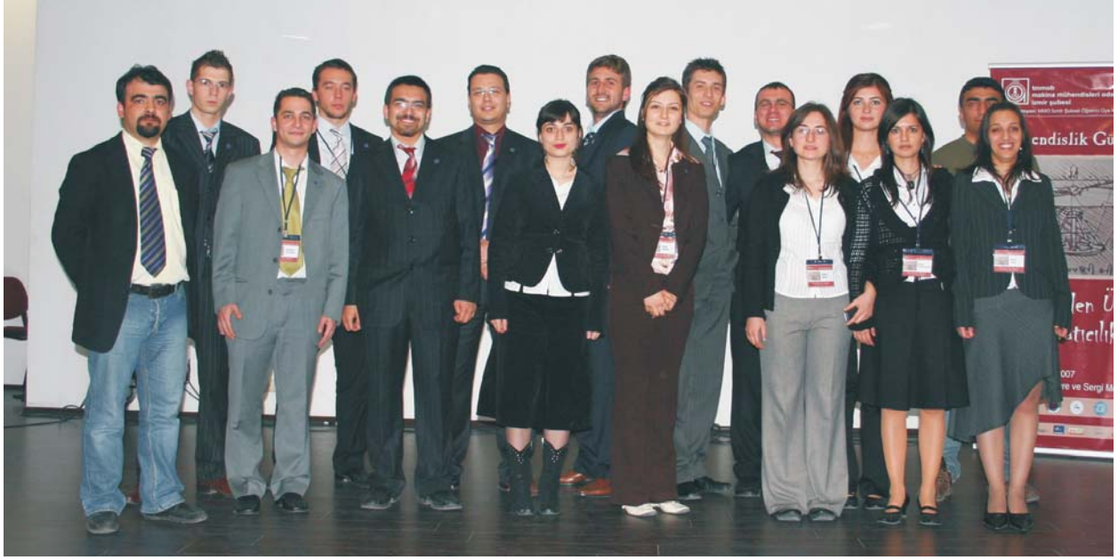
Öğrenci Üye Komisyonumuz Mühendislik Günleri 2007'nin Organizasyonunda aktif görev aldı.