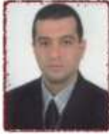
Türkey DERELİ Yönetim Kurulu Üyesi