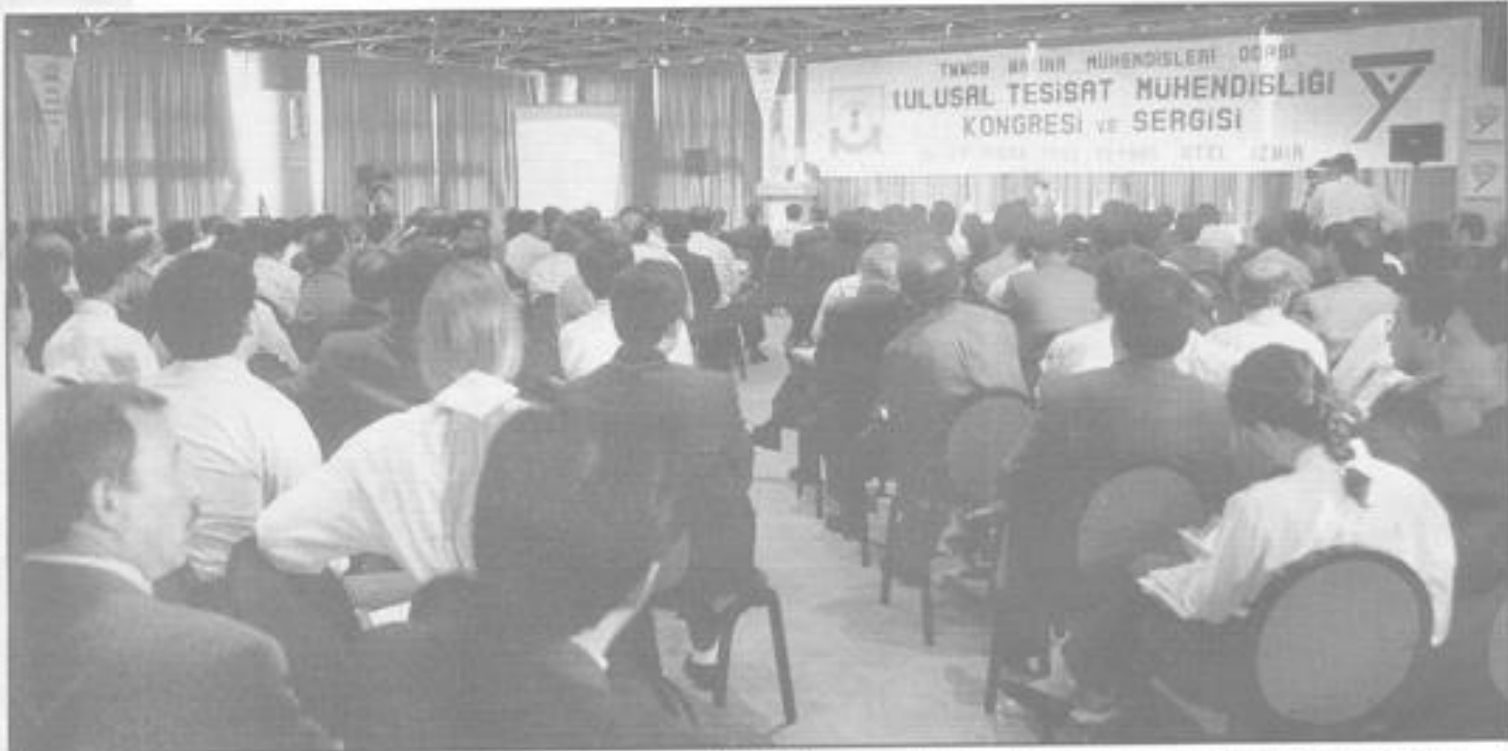
I. Ulusal Tesisat Mühendisliği Kongresi ve Sergisi eksilmeyen bir katılımı üç gün boyunca sürmüştü.