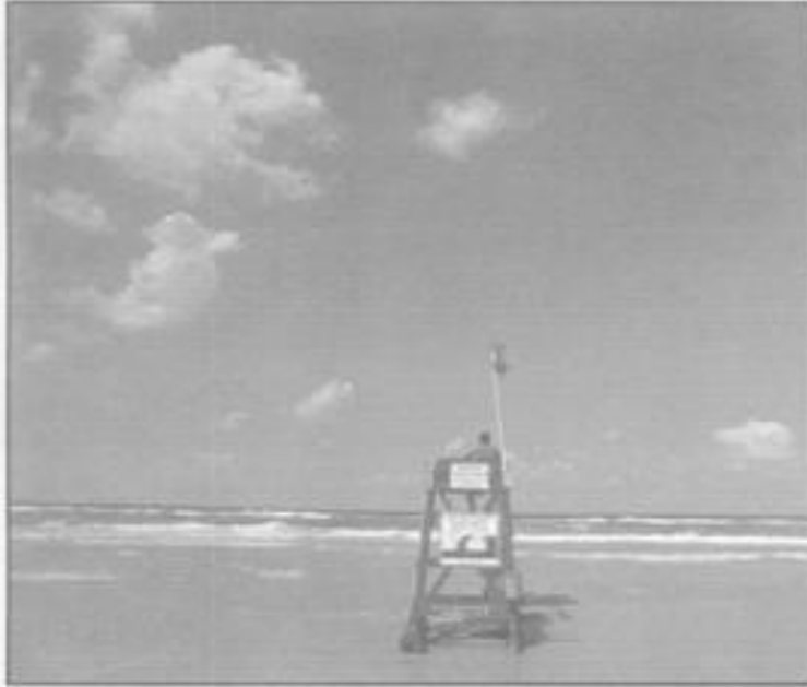
Elkro-Tek tanıtım çalışmalarına önem veriyor