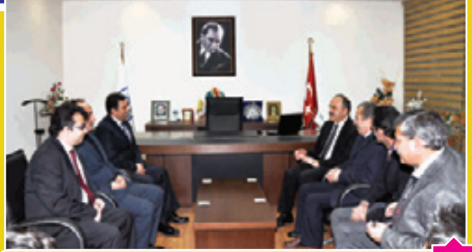
Konya Valisi Muammer EROL