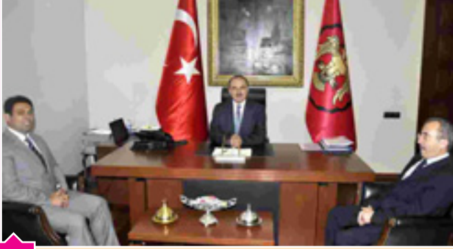
Konya Valisi Muammer EROL