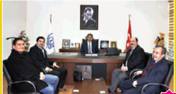
Mevlana Kalkınma Ajansı Yetkilileri