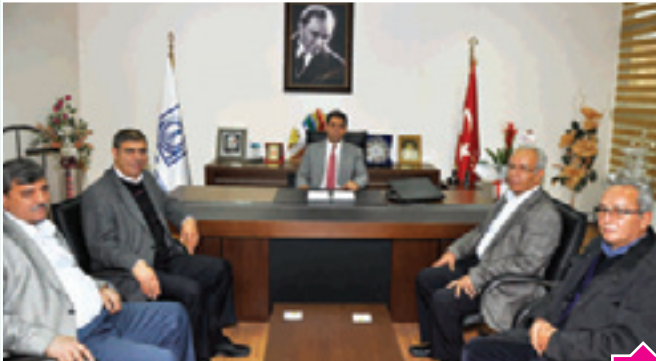
İnşaat Müh. Odası Konya Şube Yöneticileri