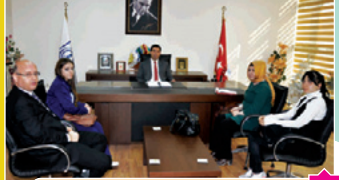
S.Ü. Endüstri Müh. Bölümü Öğrenci Topluluğu