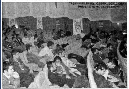
Kurultaya çok sayıda öğrenci katıldı.