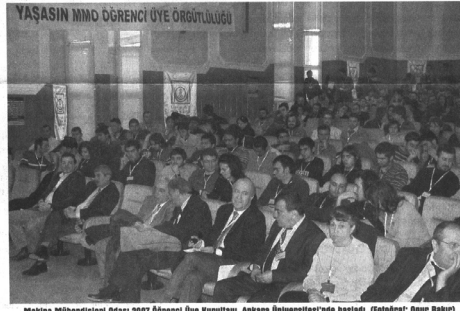
Makina Mühendisleri Odası 2007 Öğrenci Üye Kurultayı, Ankara Üniversitesi'nde başladı.

Kurultayın açılışında konuşan MMO Başkanı Emin Koramaz, 10 yıldır öğrenci üye çalışmalarını sürdürdüklerini belirterek, öğrenci üye sayısının 5 bini geçtiğini kaydetti. Kurultaydan önce yerel kurultaylar düzenlendiğini ve bu kurultaylardan süzülüp gözyüz ve felsefeli tartışmaların yapıldığını, Ankara'da