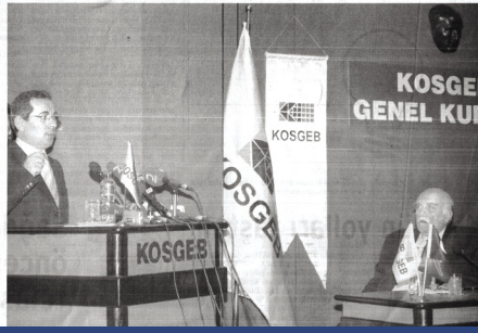
KOSGEB Genel Kurulu toplantısı.

YABANCI KAYNAK KREDİLERİ KOBİ'lerin sorunları arasında kredi bulma ve para bulma sorunu da yer almaktadır. Bu krediler daha çok AB kaynaklı kredilerdir. Türkiye'de en çok yazılan, komşuların kollarından binisi dertleri bir yarıdır. Bu yazıda bu kadar çok okunmuş yazıların önemini düşünürken, bir yarıdır.