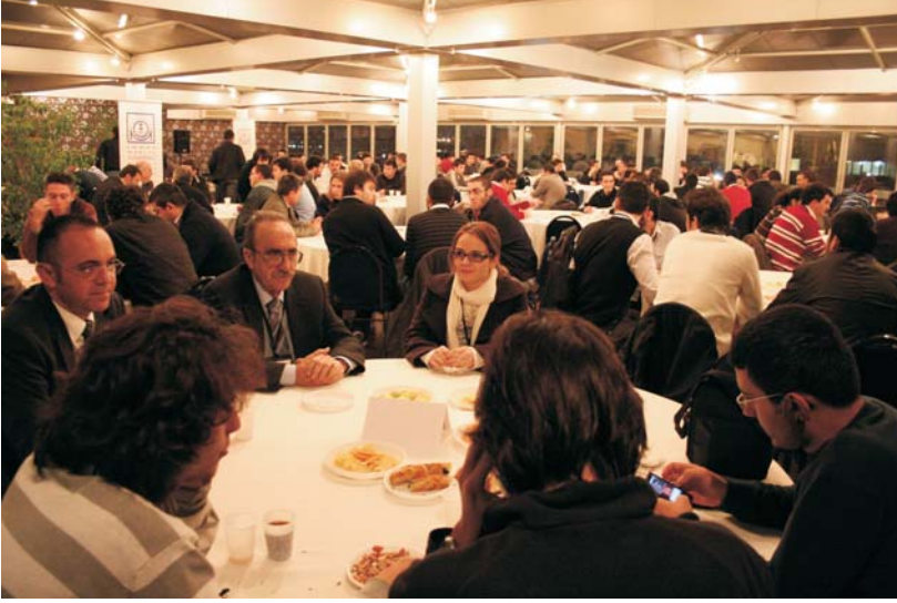
Danışmanlar ve öğrenciler ilk kez tanışma kokteylinde buluştular.

“Yollarını aydınlatacak küçük bir ışık vermek bile önemli”