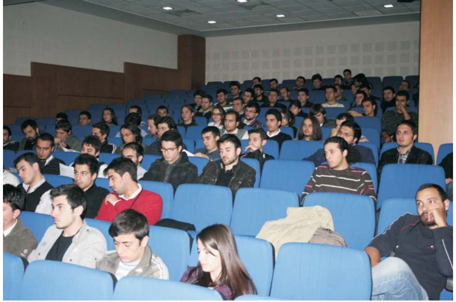
Öğrencilere danışmanlarından nasıl yararlanacakları hakkında seminer verdi.

"İki öğrencim var. Biriyle sağlık sorunları nedeniyle görüşemedik. Ancak diğeri ile çok iyi bir diyalog kurduk. Öncelikle Odamızın yürüttüğü mekatronik seminerlerine katılmasını sağladık. Yine Odamızca düzenlenen WIN Fuarları ziyaretine birlikte katıldık. Otobüs sorumlusu olarak görev yaptığım bu gezide bana yardımcı oldu. Fuarı birlikte gezdik. Bu gezinin onun için etkileyici bir deneyim olduğunu gördüm. Çok hoşuna gitti. Şimdi WIN Fuarının 2. fazına da birlikte gideceğiz. O birçok soru soracak, bizler de memnuniyetle anlatacağız. Öğrenci meraklı ve istekli olunca ona bir şeyler verdiğimiz hissetmek güzel bir duygu. 15 günlük Şubat tatilinde onu geçici bir işe yerleştirdim. Orada da yeni şeyler öğrendi ve yararlı olduğunu söyledi."