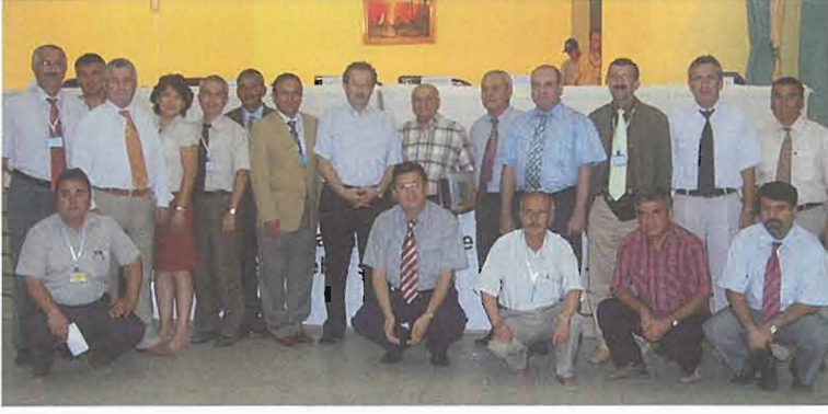
Panelist ve davetliler bir arada.

Makina Mühendisleri Odası Kütahya İl Temsilciliğinin Gediz Belediyesi ile birlikte düzenlediği "Kütahya'da jeotermal enerji ve kullanım olanakları" konulu panel 6 Ağustos 2005 Cumartesi günü Gediz Belediyesi Kültür Merkezinde yapıldı.