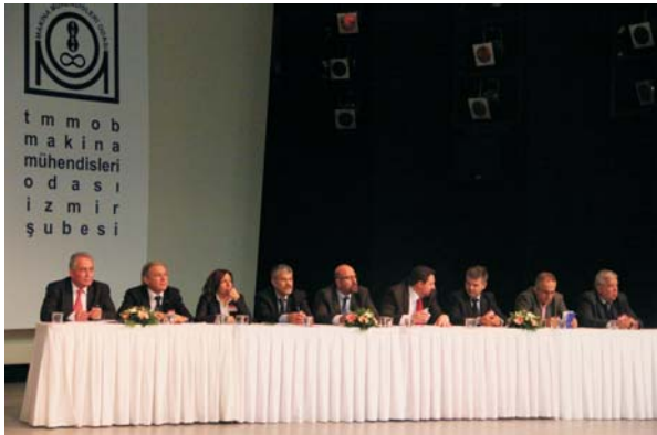
MMO İzmir Şubesi / Şubat 2012 / 12

İki yıllık süreçte ülkemizin siyasal ve sosyal alanlara dair görünümünde de maalesef geriye gidiş vardır. Demokrasi, eşitlik, adalet söylemlerini dilinden düşürmeyen 'takiyeci' siyasi iktidarın ülkedeki toplumsal muhalefete karşı tutumu gittikçe sertleşmektedir. Hak arama mücadelesi verenler yoğun polis şiddetine maruz kalmakta, hakkını aramaya çalışanlar baskı ve şiddetle yıldırılmaya çalışılmakta, Türkiye adeta açık bir cezaevine dönüşmekte, her yeni güne tutuklama haberleriyle başlanmaktadır. İnsanca yaşamak isteyen işçiler, suyunu ve toprağını korumak isteyen köylüler, parasız eğitim isteyen öğrenciler, ülkemizde füze kalkını istemeyenler, gerçeğin peşindeki gazeteciler, adalet arayan avukatlar, yani haklarını arayan herkes tutuklanmaktadır. Tutuklamalar, seçilmiş milletvekillerine, belediye başkanlarına ve siyasi parti yöneticilerine kadar