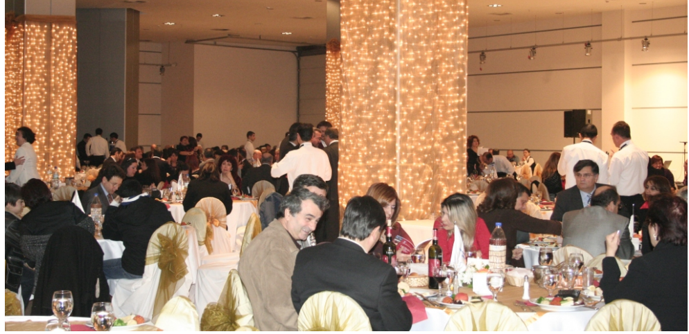
Geceye 500'ü aşkın üyemiz ve yakını katıldı.

Şubemiz, Odamızın kuruluşunun 54. Yıldönümünü 17 Ocak'ta Tepekule Kongre ve Sergi Merkezinde coşkulu bir gecede, 500'ü aşkın üyesiyle kutladı.