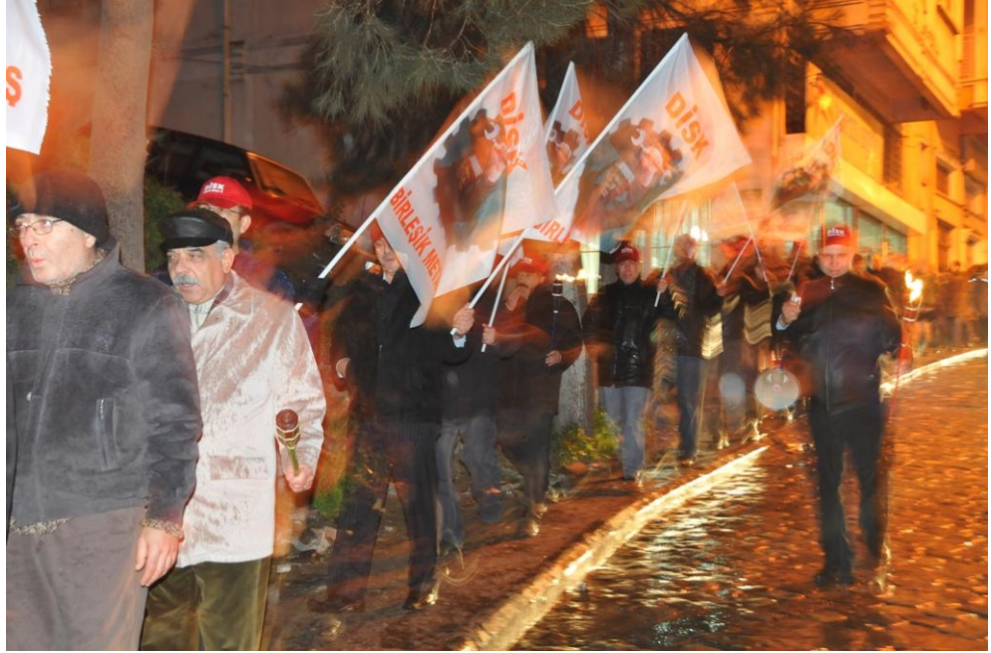
İzmir’de 2009 bütçesi protesto edildi

“2009 Bütçesi yatırımlar ve sosyal harcamaların düşüklüğü, faiz giderleri, faiz dışı fazla ve dolaylı vergilerin yüksekliği ve gelir vergisi adaletsizliği yönleriyle ekonomik sosyal bunalımı körükleyici bir içeriğe sahiptir.”