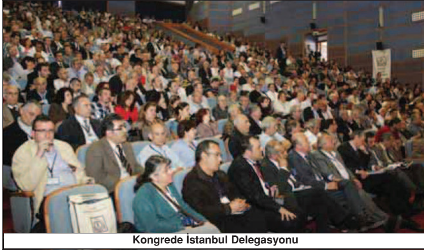
Kongrede İstanbul Delegasyonu

Liberal uygulamaların bir parçası olan iş ve sağlık yasalarıyla çalışanların hakları budanmakta, halkımızın sağlığı piyasa koşullarının insafına terk edilmektedir. Egemen ekonomik politikaların belirleyicileri, ülkemizi ucuz iş gücü deposu olarak görmekte, emekçilerin her türlü sağlıksız ve